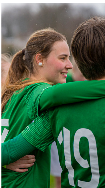
PIŁKA NOŻNA DZIEWCZĄT I Kobiet (OD 2020 R.)