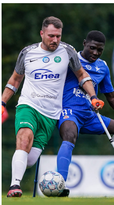
SEKCJA AMP FUTBOLU WARTY POZNAŃ (OD 2020 R.)